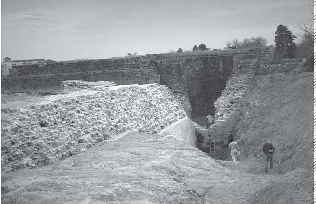
Tour Ouest du château Pierre II