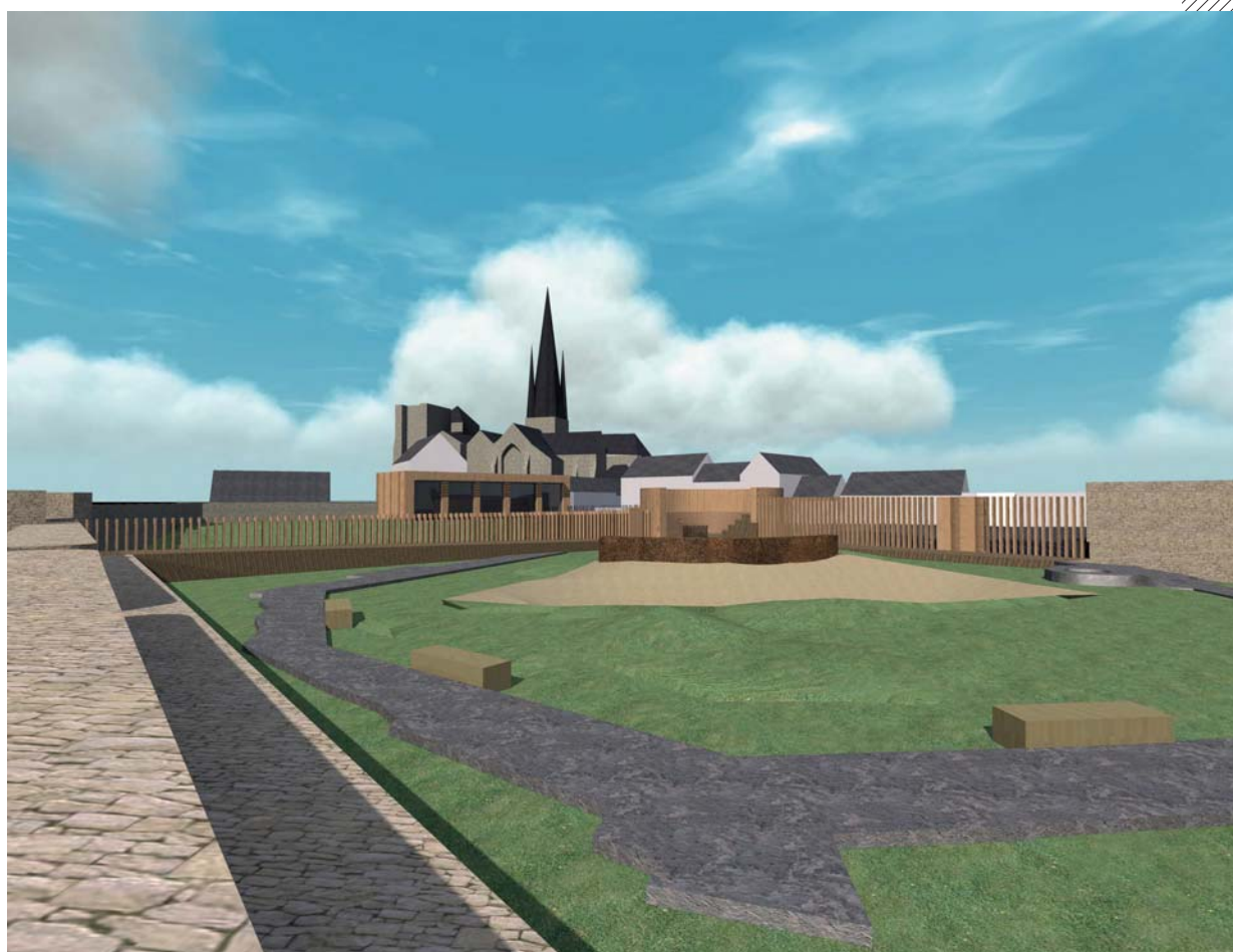
Modélisation du château Pierre II (Devernay Architectes)

Cette mise en valeur offre un parcours pédagogique et culturel en répondant aux exigences d'accessibilité et de sécurisation du site.