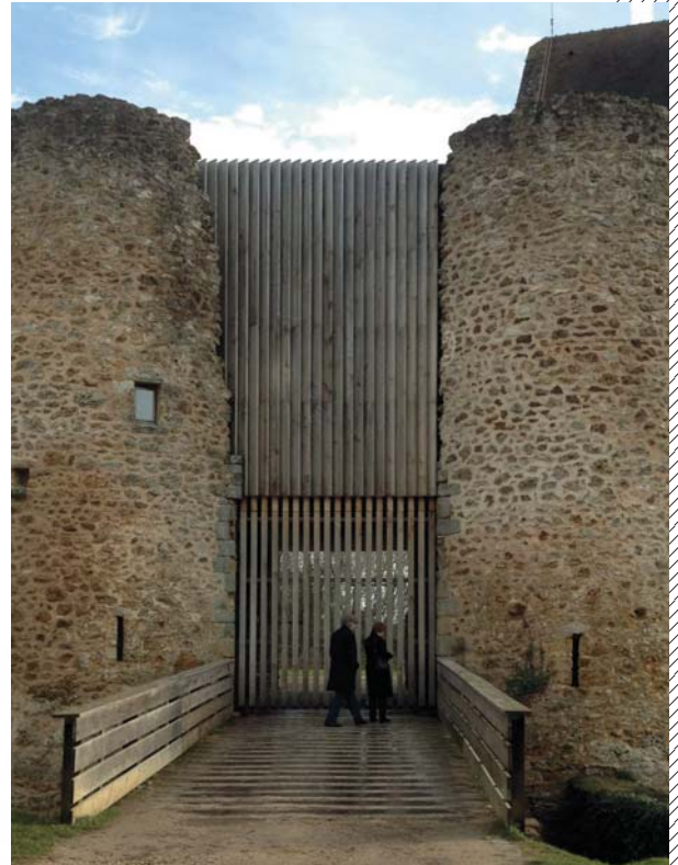
Château de la Madeleine, Chevreuse : Exemple de porte palissée à claire voie et de bardage à clin, (Devernay Architectes)