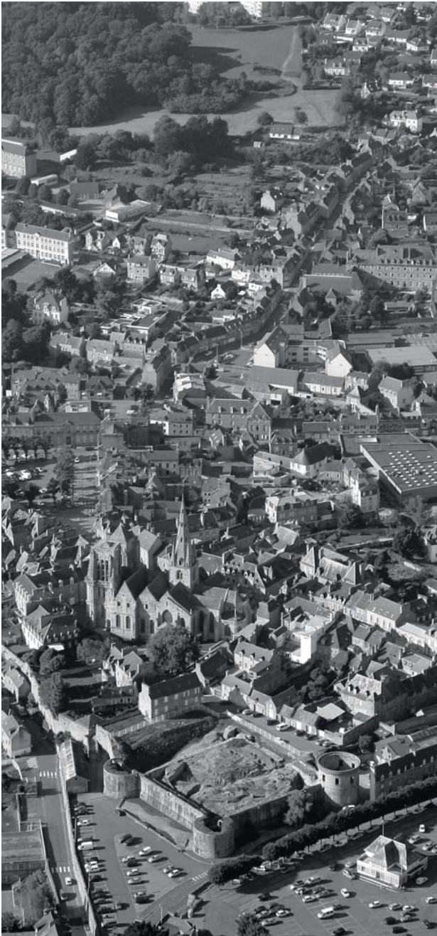
Vue aérienne du château et du centre historique de Guingamp