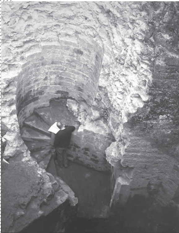
Escalier de la Tour Ouest