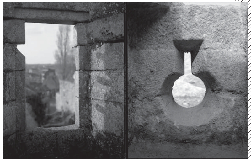
Baie et cannonnière du château Pierre II